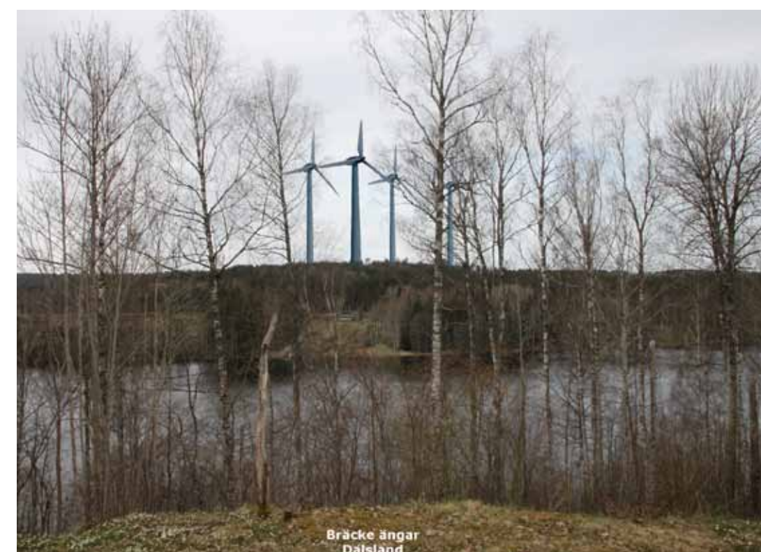
Bräcke ängar Dalsland

Bild 2. Område Å6 Södra & Norra. Vy mot sydväst från badviken, Edslan.