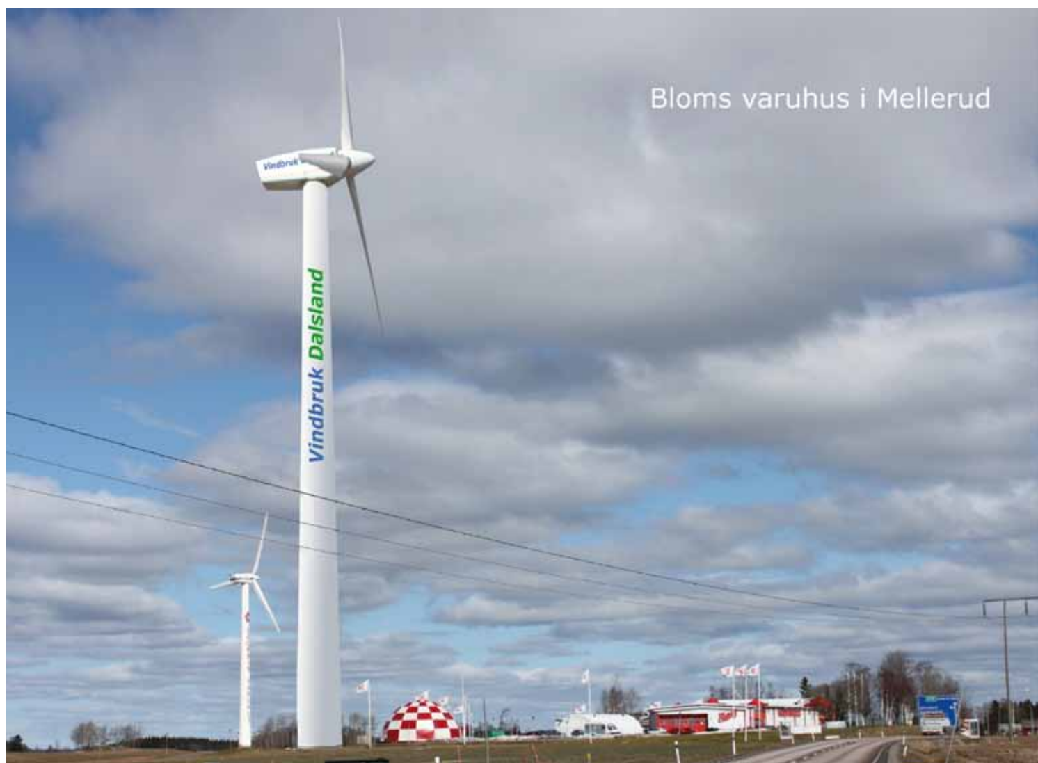
Bloms varuhus i Mellerud