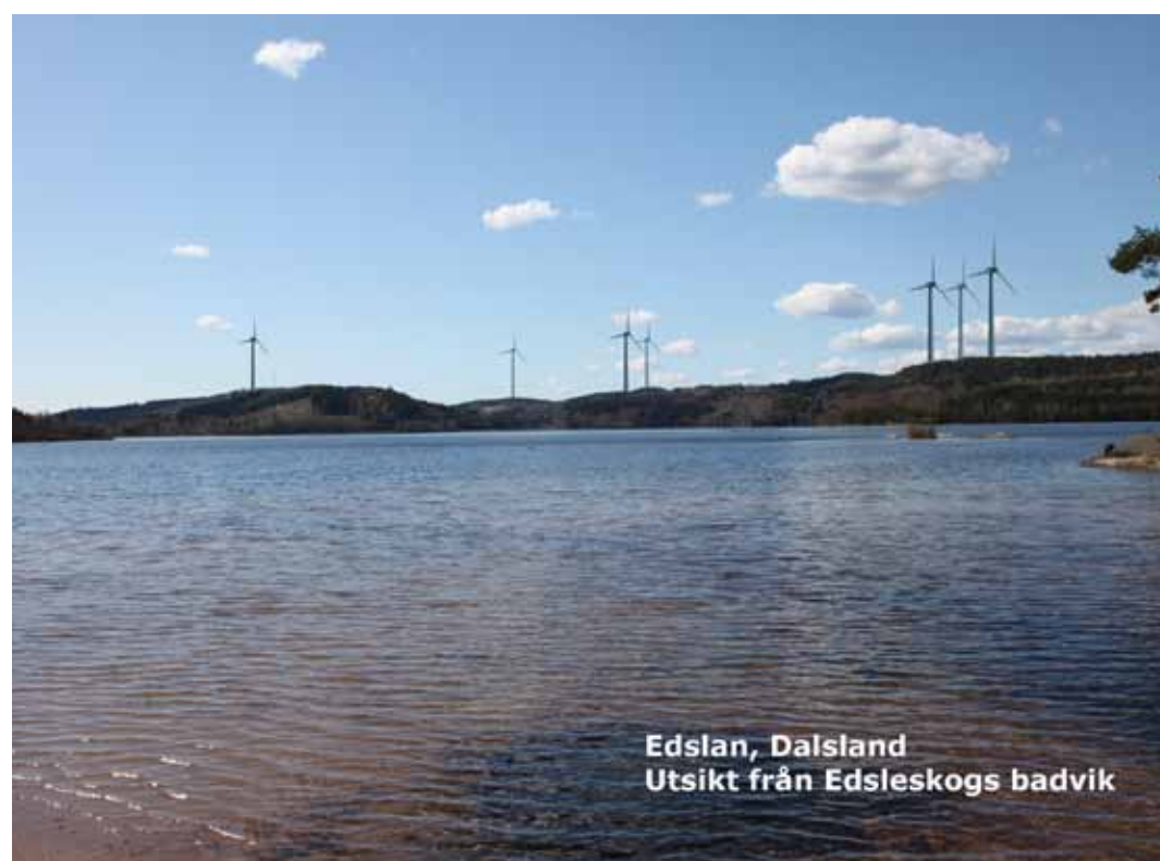
Edslan, Dalsland Utsikt från Edsleskogs badvik

Bild 1. Område Å6 Norra. Vy mot väster från Timmerviken, Edslan. Skuggbildningar och ljusreflexer blir periodvis påtagliga för de boende vid den här viken i det så kallade ”Området”.