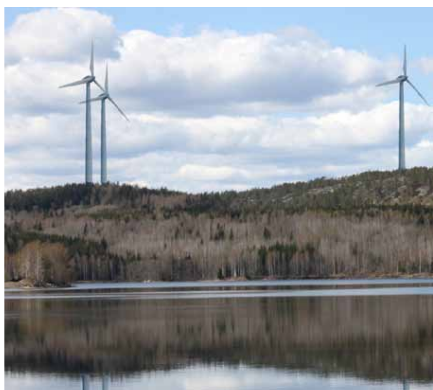
Bild 1. Område Å6 Norra. Vy mot väster från Timmerviken, Edslan. Skuggbildningar och ljusreflexer blir periodvis påtagliga för de boende vid den här viken i det så kallade ”Området”.

Google-Earth version av Edsleskogsområdet. Här finns också några avstånd inlagda samt säkerhetsområden. (De röda cirklarna med radie på 500 meter).